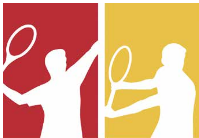
Fognini étouffe Zverev