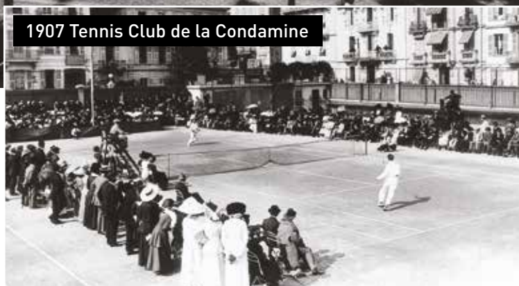
1907 Tennis Club de la Condamine