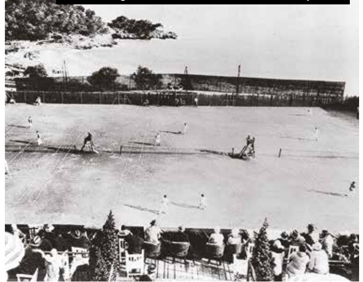
1928 Inauguration du Monte-Carlo Country Club

125 ans après, le Rolex Monte-Carlo Masters garde ses lettres de noblesse : il est un des tournois majeurs du tennis mondial, avec, à chaque édition, les meilleurs joueurs du monde. On y a vu s'y révéler Richard Gasquet, Björn Borg mettre fin à sa carrière et Rafael Nadal battre les records... Le Rolex Monte-Carlo Masters est un centenaire en pleine forme !