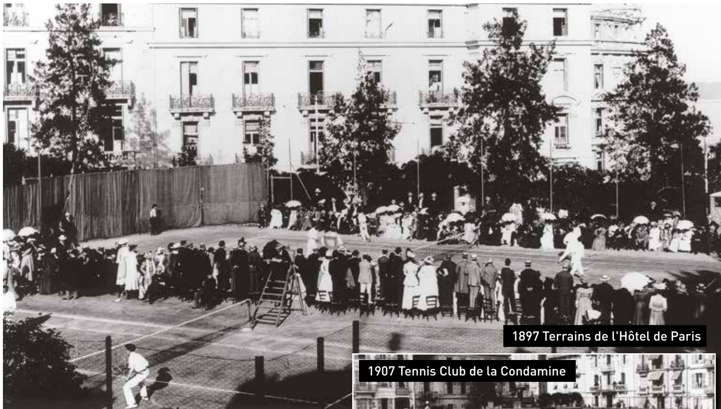
1897 Terrains de l'Hôtel de Paris

125 ans de bonheur, d'anecdotes et de surprises sur les courts de la Principauté