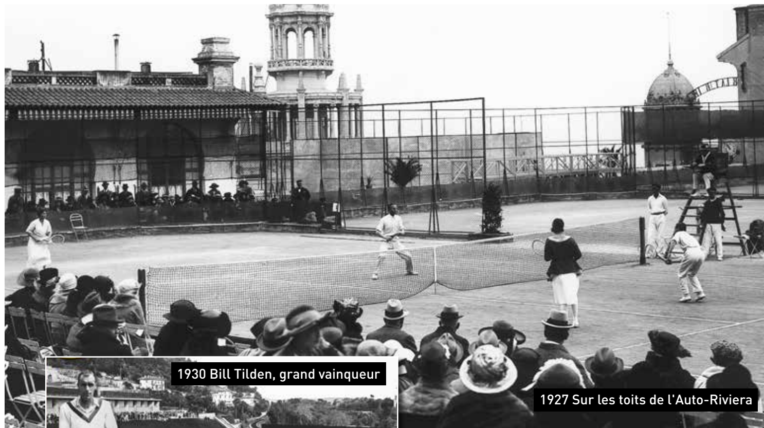
1930 Bill Tilden, grand vainqueur

125 ans de bonheur, d'anecdotes et de surprises sur les courts de la Principauté