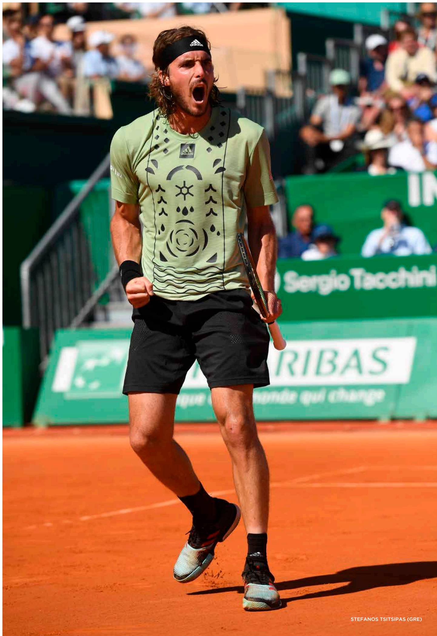
STEFANOS TSITSIPAS (GRE)