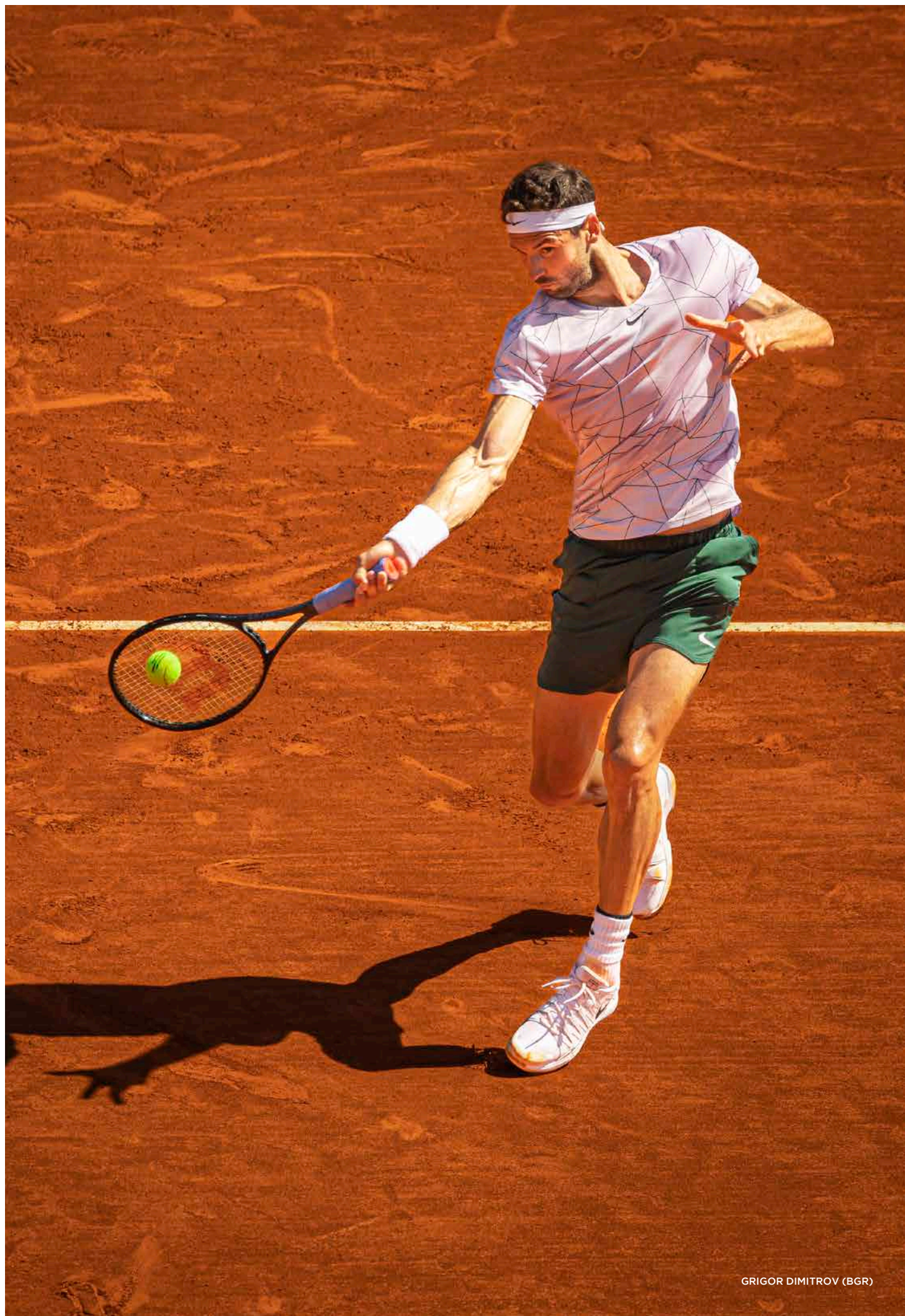
GRIGOR DIMITROV (BGR)