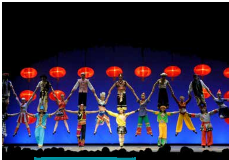
2003 : Ballet Pékin