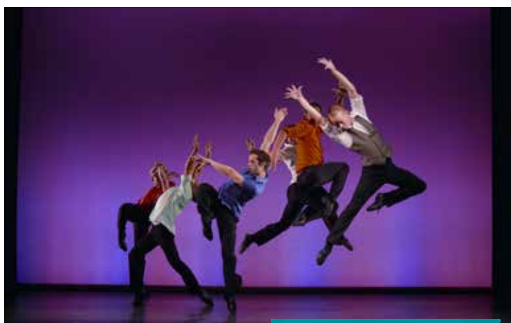
2012 : Rock The Ballet